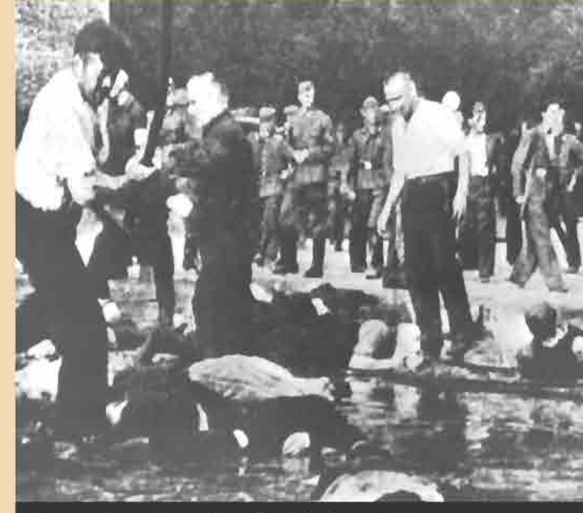
Jews beaten to death by Lithuanian civilians, under German supervision, Kovno, June 28, 1941.