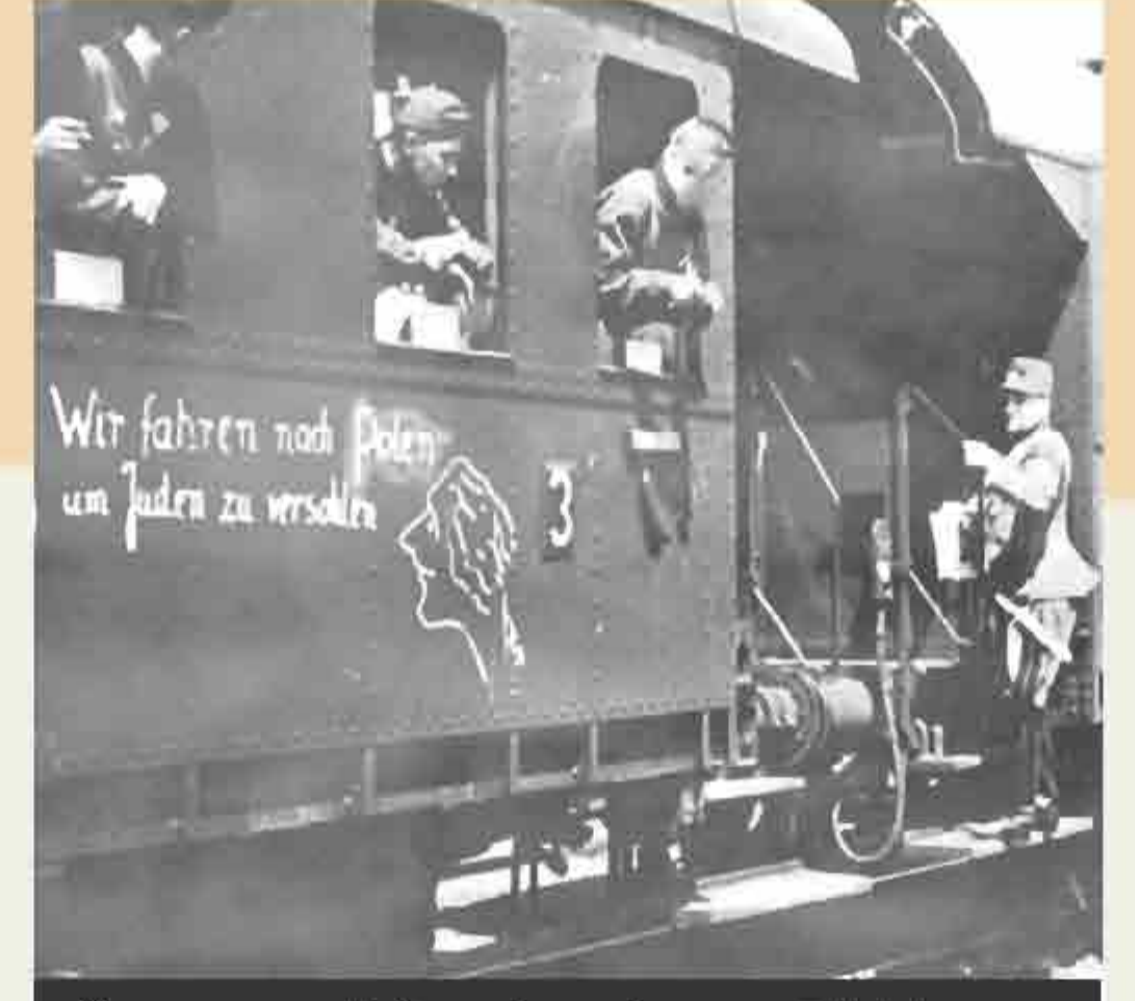
German soldiers head east. Writing on side of train car reads: "We're off to Poland, to thrash the Jews."