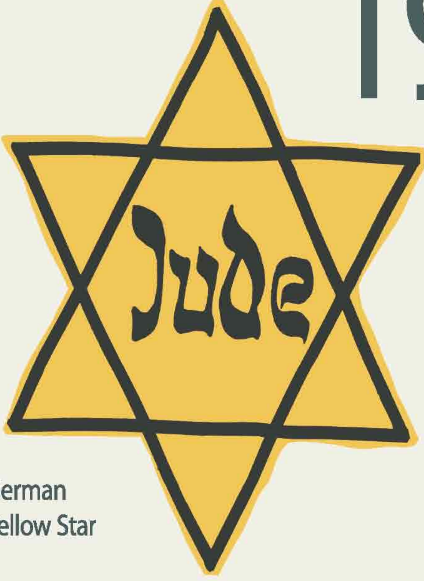
German Yellow Star

"By reason of their birth and race, all Jews are part of an international conspiracy against National Socialist Germany. The treatment we give them does them no wrong. They have more than deserved it."