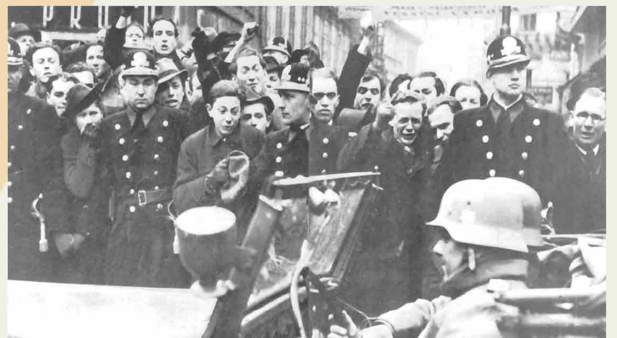
Angry Czechs watch German troops enter Prague after Czechoslovakia capitulates, March 15, 1939.