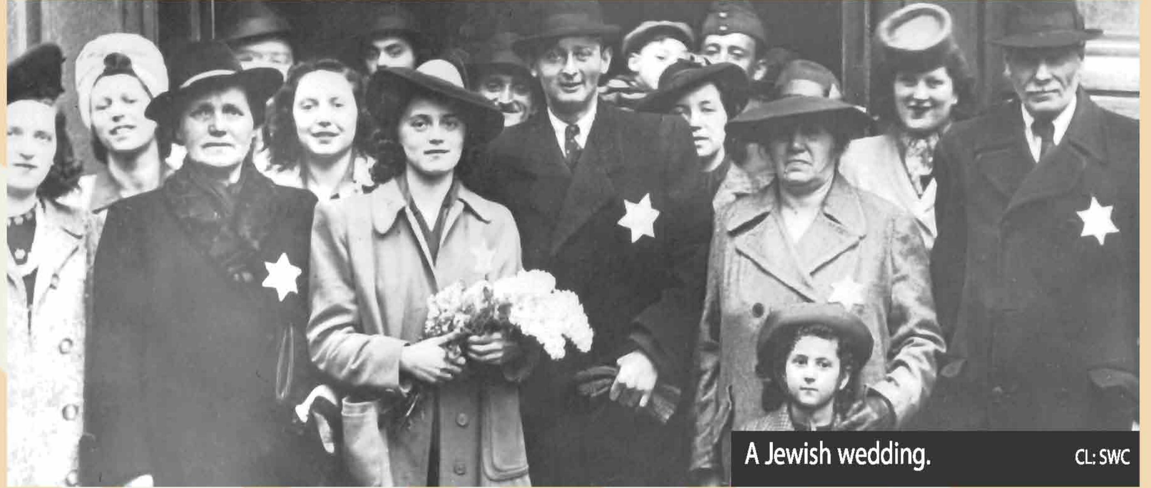
A Jewish wedding.