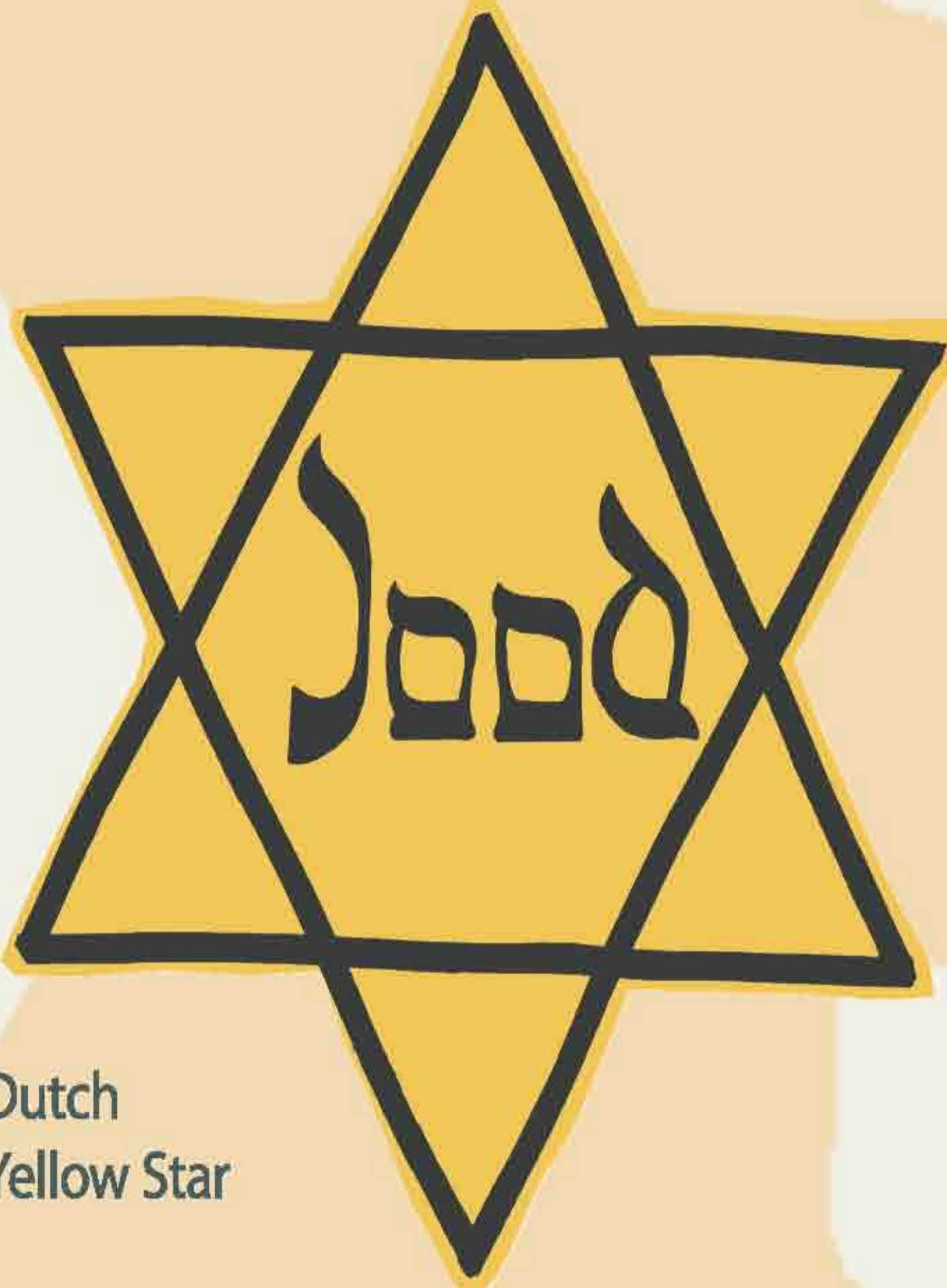
Dutch Yellow Star

WITH THE OUTBREAK OF WAR ON SEPTEMBER 1, 1939, ANY CONSTRAINT Hitler or the Nazis felt toward the treatment of the Jewish people was removed. The Nazis' murderous intent was revealed immediately in the aftermath of the invasion of Poland. Atrocities against Jews in the occupied territories began almost immediately. The period of 1939- 1941 was one of planning and experimentation in preparation for the "Final Solution." By June 1940, the Nazis occupied The Netherlands, Belgium, and France. By midsummer of 1941, Germany controlled most of Europe and millions of Jews came under Nazi oppression. On July 31, 1941, Göring ordered Reinhard Heydrich to make "all necessary preparations with regard to organizational, substantive and financial viewpoints for a total solution of the Jewish question in German-occupied Europe."