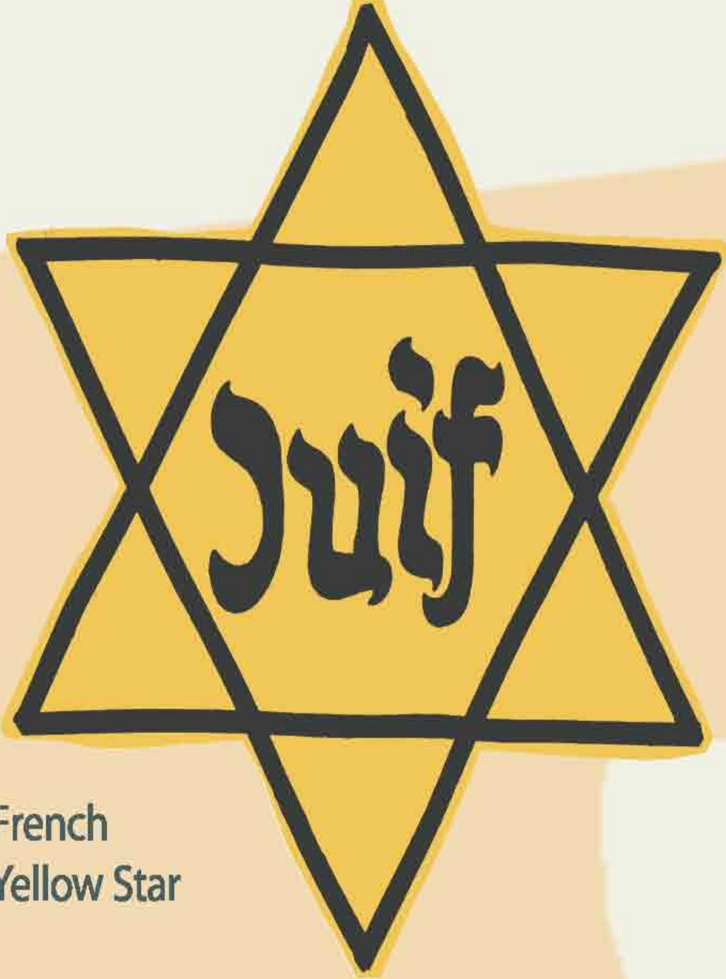
French Yellow Star

หลังจากเกิดสงครามในเดือนกันยายน พ.ศ. 2482 การยับยั้งใดๆ เกี่ยวกับชาวยิวก็หมดไป ฮิตเลอร์และนาซี ดำเนินการฆ่าล้างเผ่าพันธุ์ชาวยิวอย่างเปิดเผย ระยะเวลาระหว่างปี พ.ศ. 2482-2484 เป็นช่วงของการวางแผนและการทดลอง เพื่อนำไปสู่ "การแก้ปัญหาสุดท้าย" (Final Solution) เยอรมันยึดครองเนเธอร์แลนด์ เบลเยียม และฝรั่งเศสได้ในปี พ.ศ. 2483 ในกลางปี 2484 ก็สามารถครอบครองยุโรปไว้ได้เกือบทั้งหมด ชาวยิวที่หนีออกจากเยอรมันไปได้กลับตกอยู่ในเงื้อมมือนาซีอีกครั้ง 31 กรกฎาคม พ.ศ. 2484 เกอริง (Goering) มีคำสั่งให้ไรน์ฮาร์ด เฮย์ดริช (Reinhard Heydrich) จัดเตรียมการทุกอย่าง ทั้งด้านงบประมาณและการจัดการเพื่อทำการแก้ปัญหาชาวยิวในเขตการครอบครองของเยอรมันให้เป็นจริงได้ในที่สุด